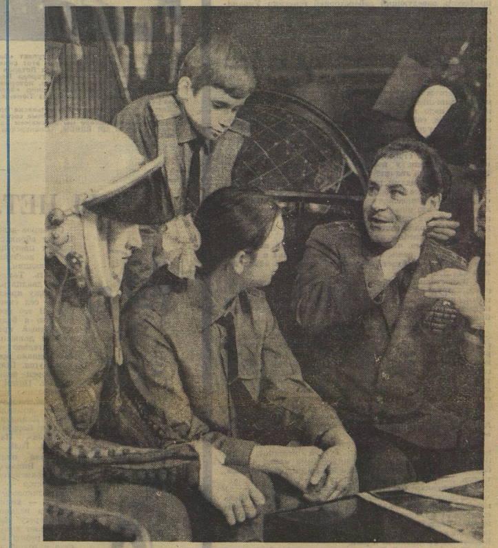
Этой встречи давно ждали юные космонавты Московского Дворца пионеров. Космонавт-2 Герман Степанович Титов пришёл к ребятам поговорить об их будущем. В этот день ребята ещё больше полюбили свою мечту. Ещё твёрже решили добиться цели.